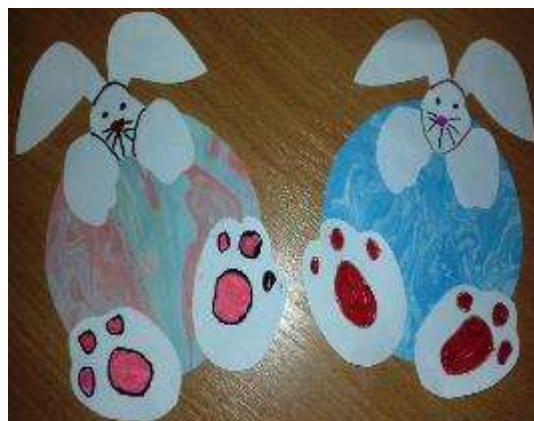
Рис.3 Пасхальные зайцы