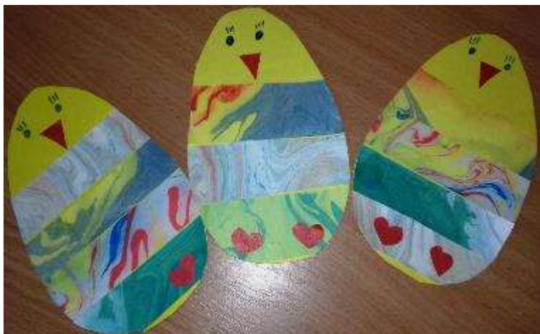
Рис.4 Пасхальные яйца