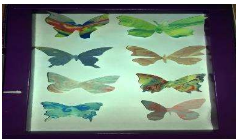
Рис.5 Панно «Бабочки»