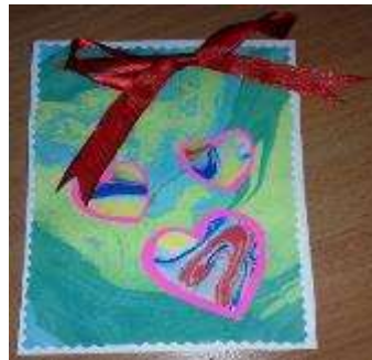
Рис.1 Блокнот – подарок к 8 марта

-готовые поделки детей, выполненные в данной технике.